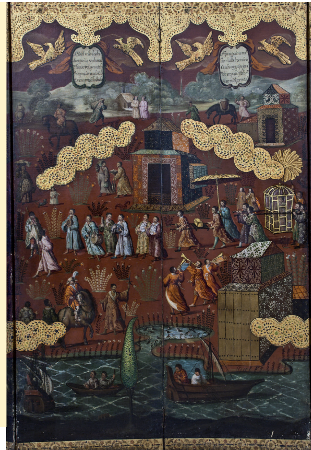
Imagen: Anónimo novohispano, Biombo del sello real , 1676-1700, Museo de América, Madrid